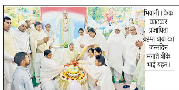
भिवानी। केक काटकर प्रजापिता ब्रह्मा बाबा का जन्मदिन मनाते बीके भाई बहन।