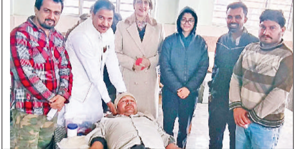
भिवानी। रक्तदान करता रक्तदाता।