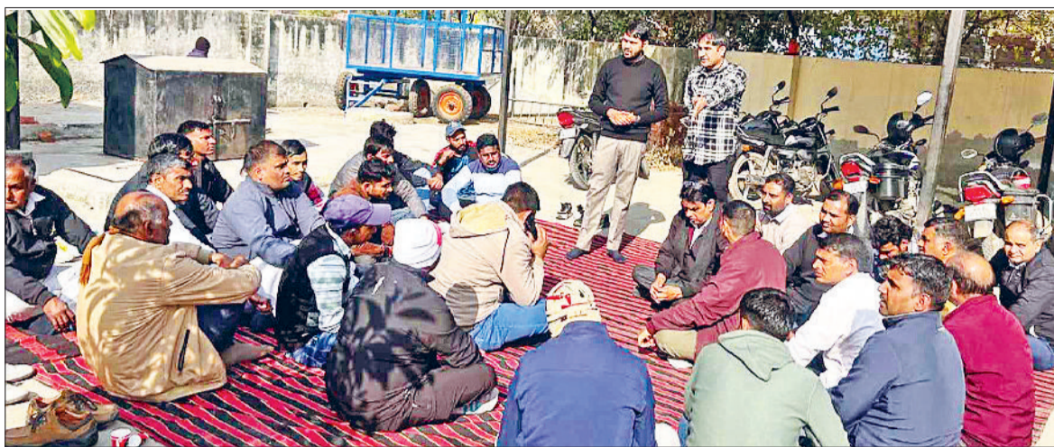
महेंद्रगढ़। निगम कार्यालय में बैठक करते बिजली कर्मचारी।