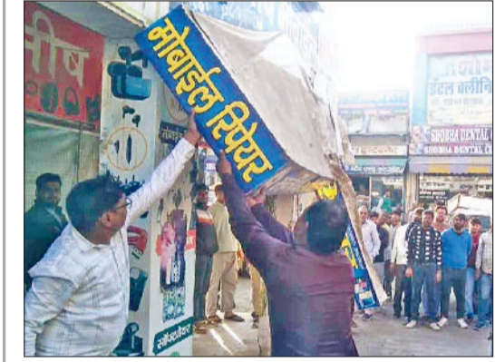
महेंद्रगढ़। दुकान के आगे लगा फ्लैक्स हटाने कर्मचारी व दुकानदार को चेतावनी देते कर्मी।

नगर पालिका सख्त: 25 साल में पहली बार होगी कार्रवाई शॉपिंग कॉम्प्लैक्स के बरामदे, चबूतरे हटाने के लिए 4 दिन का अल्टीमेटम