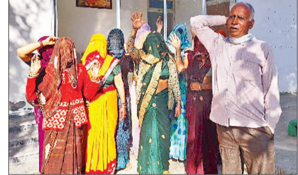
नांगल चौधरी। विभाग के दफ्तर में प्रदर्शन करती हुई वार्ड-4 की महिलाएं।

नांगल चौधरी: महाराया पेयजल संकट, महिलाओं ने जताया रोष