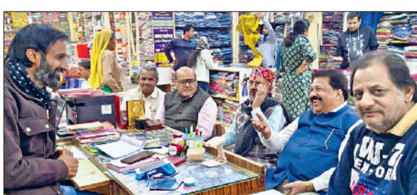
नारनौल। बैठक करते व्यापार मंडी के पदाधिकारी।

पुल बाजार से मेहता चौक तक के मार्ग का निर्माण 15 मार्च के बाद करने की मांग