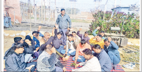
भिवानी। ट्रांसफर पॉलिसी के विरोध में बिजली कर्मचारी।