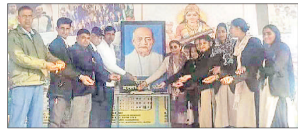
महेंद्रगढ़। सरकार पटेल के चित्र पर पुष्पापित करते हुए।